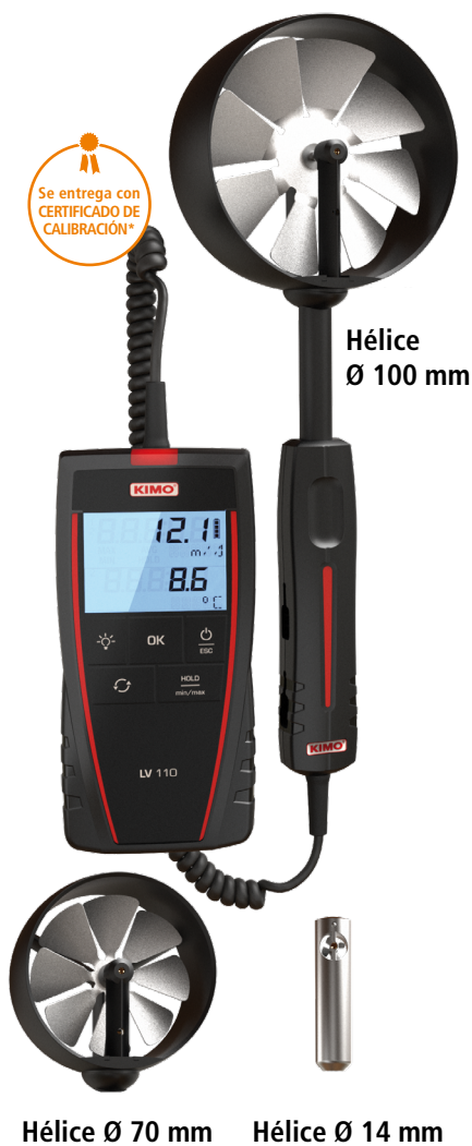
Hélice Ø 100 mm

Se entrega con CERTIFICADO DE CALIBRACIÓN*